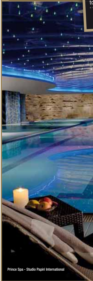
Prince Spa - Studio Papiri International

Bellezza, particolarità, raffinatezza e perfezione per ambienti termali e per spazi wellness, conoscibili mediante una scansione temporale cadenzata attraverso diverse espressività architettoniche. Un importante premio internazionale per tre realizzazioni firmate da altrettanti visionari interpreti, capaci di trasferire e segnare nel tempo indelebili pensieri, quanto di attribuirgli incredibile corporeità. Cosmoprof Worldwide ha omaggiato attraverso questo premio straordinari creatori che tramite la loro opera hanno definito e stanno definendo nuovi repertori possibili e nuove tematiche contenutistiche per i luoghi dedicati alla rigenerazione psico-fisica.