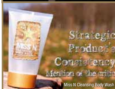
Miss N Cleansing Body Wash