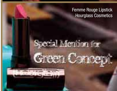
Femme Rouge Lipstick Hourglass Cosmetics