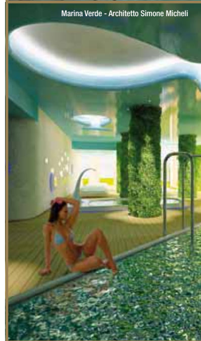
Marina Verde - Architetto Simone Micheli