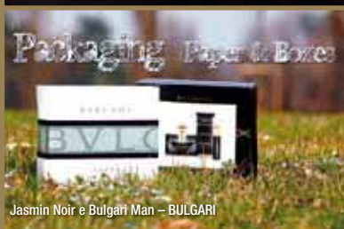
Jasmin Noir e Bulgari Man - BULGARI