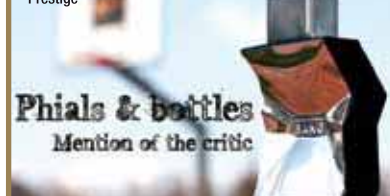
Bang by Marc Jacobs - Coty Prestige

The winner is: Bormioli Luigi Brand: Lady Million - Paco Rabanne - PUIG Per la suggestiva forma "a gemma" dai riflessi dorati.