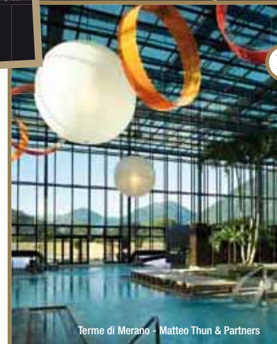
Terme di Merano - Matteo Thun & Partners