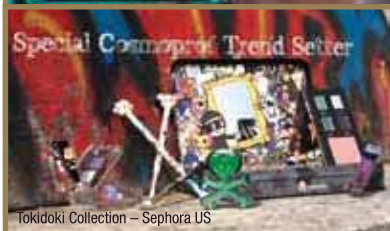
Tokidoki Collection - Sephora US