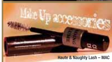
Haute &amp; Naughty Lash - MAC

The winner is: Albea Brand: Haute & Naughty Lash - MAC Per aver radunato in un solo prodotto gli elementi, in precedenza divisi, per dare volume e per definire le ciglia.