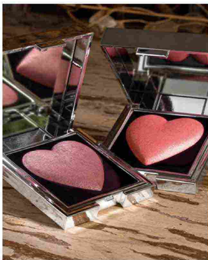
(sopra, Red Valentine Capsul Collection di Mesauda Milano)

Più la data si avvicina, più, oltre all'amore, aumentano i numeri. In Italia, nel 2019 il Codacons stimava un giro di affari di 350 milioni di euro, con una spesa pro capite di 30€. Anche nel 2020, appena prima dell'inizio della pandemia, si è assistito a un piccolo positivo delle vendite. E tutto lascia intendere che anche quest'anno, nonostante le obiettive difficoltà logistiche e di spostamento dei consumatori e le chiusure nei weekend dei centri commerciali, la leva romantica si farà sentire sugli acquisti di beni e servizi attinenti il mercato beauty .