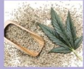
MATERIA MEDICA PROCESSING Cosmoprime