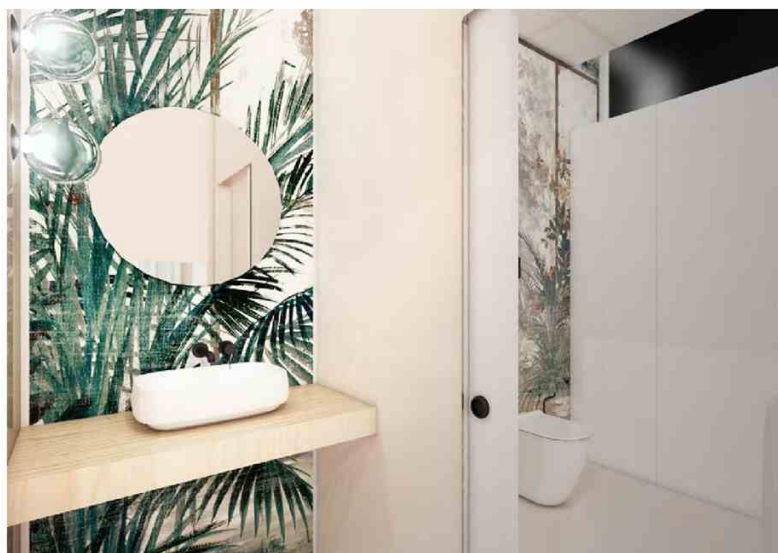
Il centro benessere dell'ospedale Sant'Orsola di Bologna.

Il centro benessere verrà realizzato nei prossimi mesi. In un'area di 100 mq all'interno di uno dei due padiglioni principali del Sant'Orsola, garantirà la cura del benessere a 360 gradi . I pazienti ricoverati avranno a disposizione i servizi di barbiere, parrucchiere, estetista e podologo .