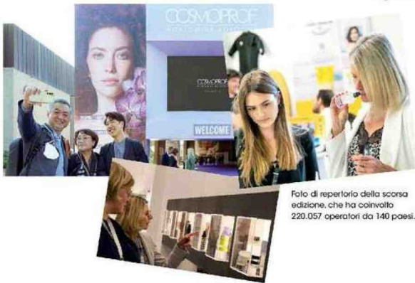
Foto di repertorio della scorsa edizione, che ha coinvolto 220.057 operatori da 140 paesi.

Da registrare anche l'aumento degli indie brands protagonisti dell'Extraordinary Gallery, area speciale del