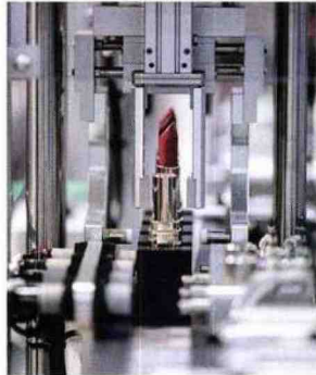
Appuntamento a Bologna dal 16 al 20 marzo con Cosmoprof Worldwide Bologna , l'evento B2B di riferimento per l'industria cosmetica. ( cosmoprof.com )