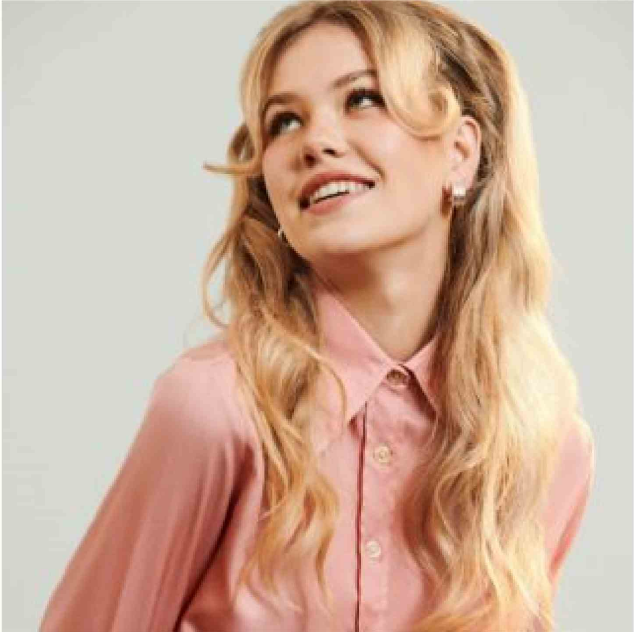
7 tonalità di biondo primavera estate 2023

Cosmoprof 2023 , in premio le forbici Cutterfly - ColoraMi